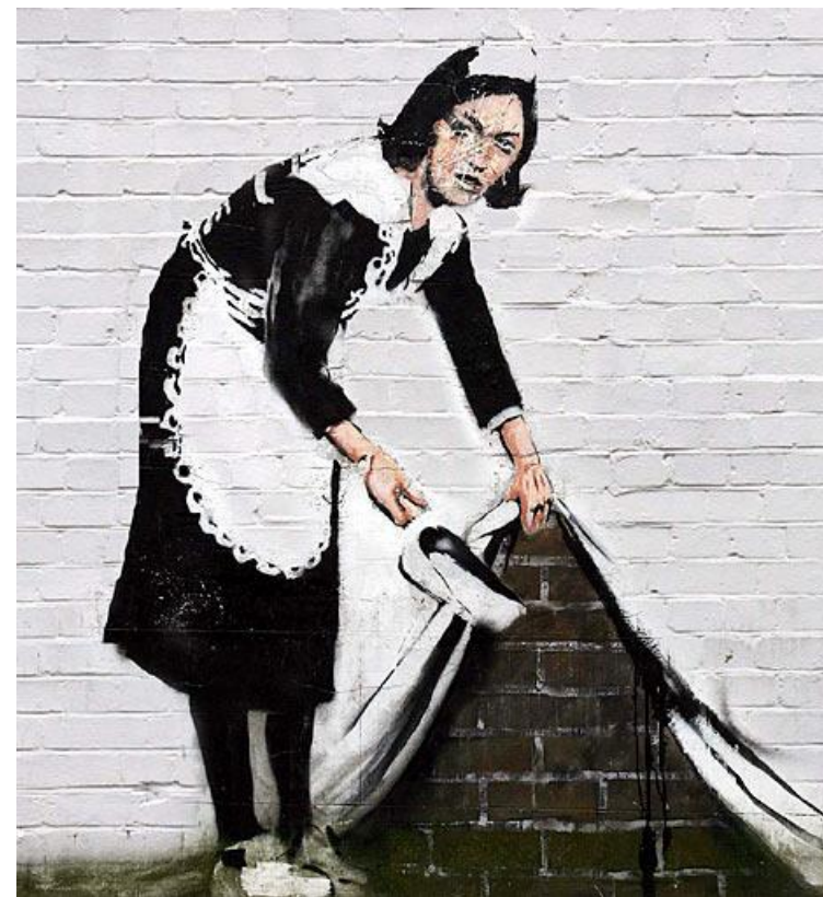
Maid in London – Banksy.

De stichting zal nimmer verplichtingen aangaan waarvoor er geen dekking is.