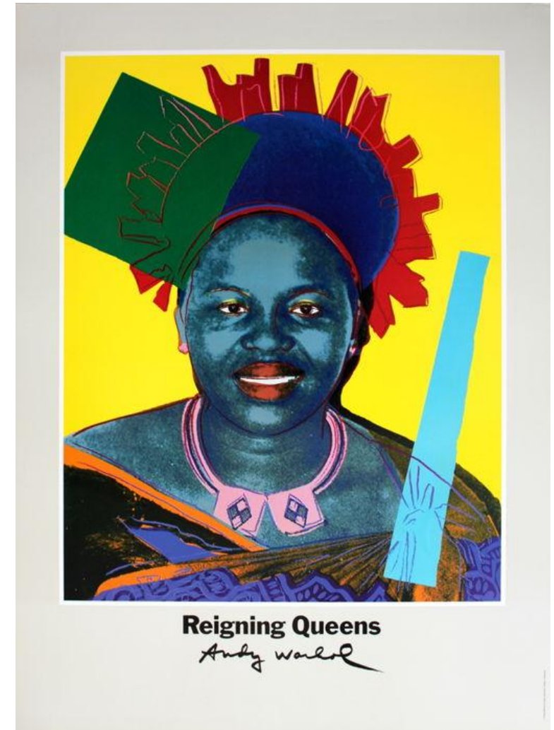
Queen Ntombi – Warhol.

Beleidsplan Stichting Stimulering Doe Kunst – 03-11-2017